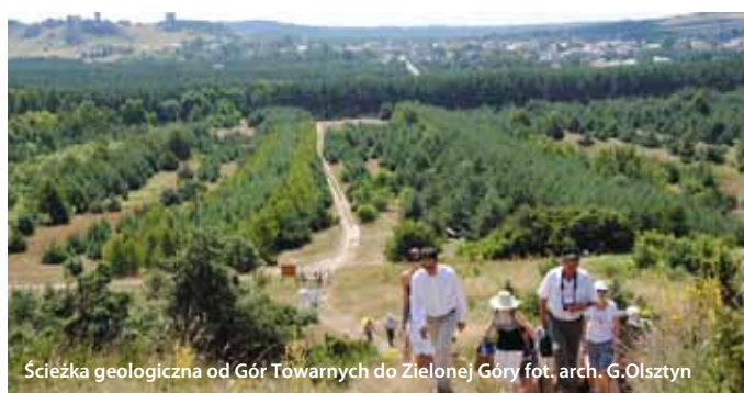
Ścieżka geologiczna od Gór Towarnych do Zielonej Góry