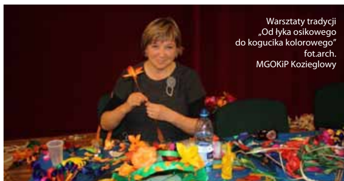
Warsztaty tradycji „Od łyka osikowego do kogucika kolorowego”