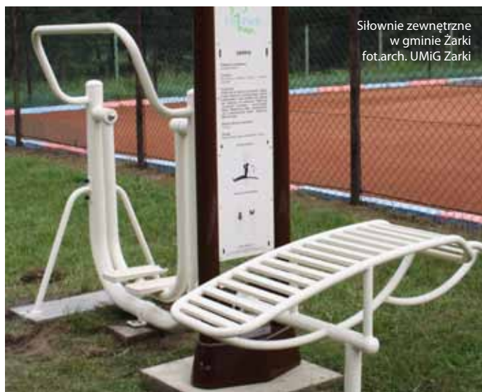
Siłownia zewnętrzna w gminie Żarki