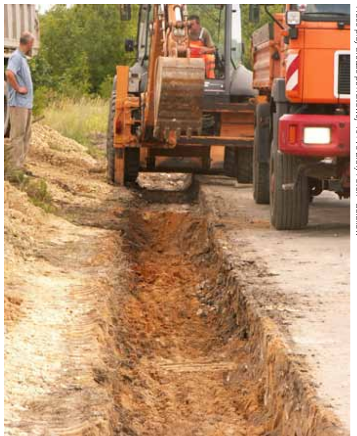
Prace przy drodze powiatowej 1014 S Złoty Potok - Gorzków