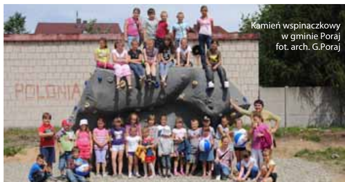
Kamień wspinaczkowy w gminie Poraj