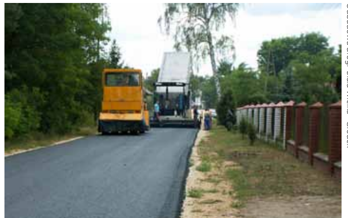
Odbudowa drogi - Biała Wielka - Gródek