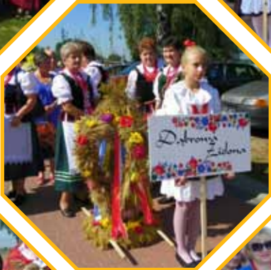
DĄBROWA ZIELONA >