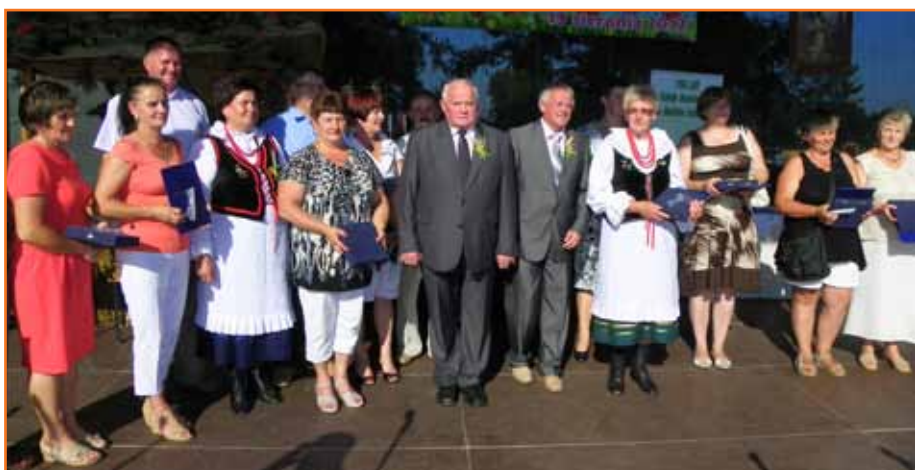
Laureaci konkursu na dożynkowej scenie ze starostą częstochowskim i wójtem gm. Konopiska