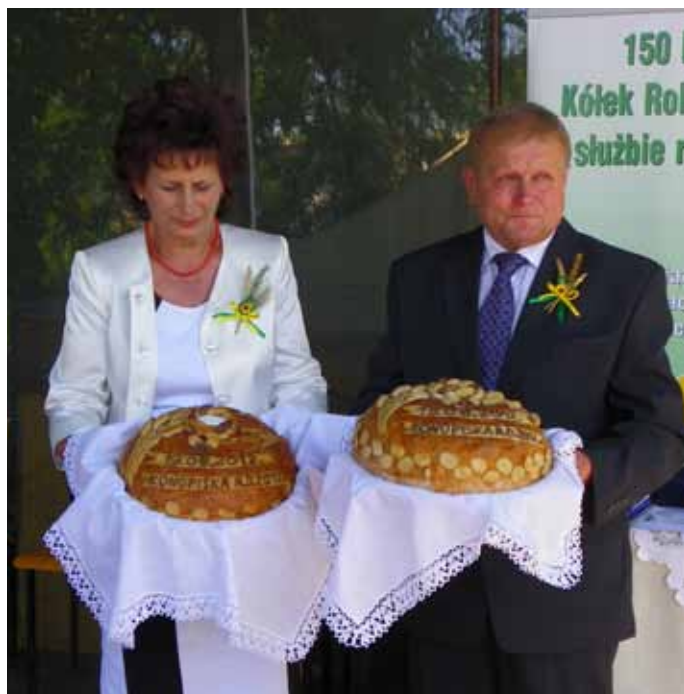
Starostowie Dożynek z bochnami chleba upieczonego z tegorocznego ziarna