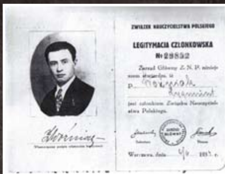
Legitymacja członkowska ZNP