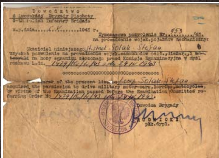
Pozwolenie tymczasowe Stefana Solaka na prowadzenie wojskowych pojazdów mechanicznych, wydane 5 V 1943r. przez Dowództwo 6 Lwowskiej Brygady Piechoty