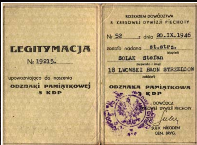
Legitymacja Stefana Solaka upoważniająca do noszenia Odznaki Pamiątkowej 5 KDP, wystawiona 20 IX 1946r. przez Dowództwo 5 Kresowej Dywizji Piechoty.