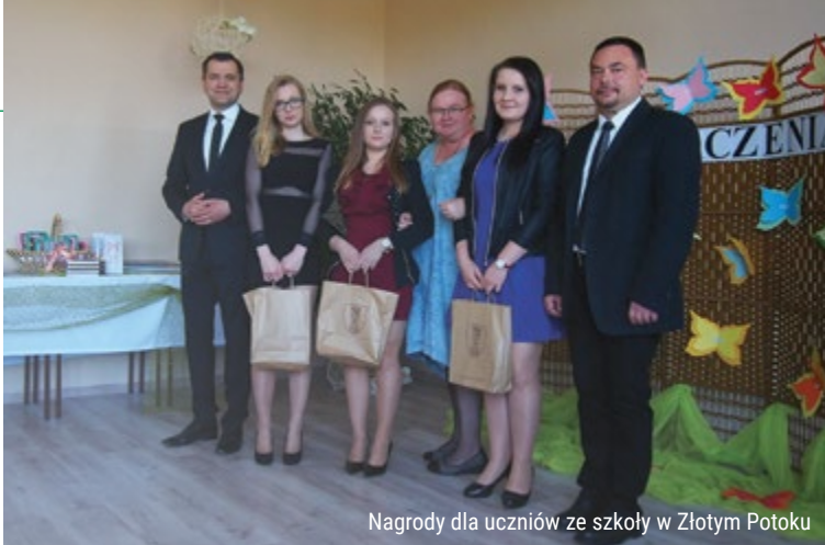
Nagrody dla uczniów ze szkoły w Złotym Potoku

Zadaniem Powiatu Częstochowskiego w zakresie edukacji jest organizacja szkolnictwa na poziomie ponadpodstawowym oraz szkolnictwa specjalnego. Zadanie to jest realizowane poprzez stworzenie sieci szkół ponadpodstawowych oraz szkół specjalnych. W poniższych tabelach prezentujemy Sieć szkół i placówek prowadzonych przez powiat częstochowski w roku szkolnym 2019/2020.