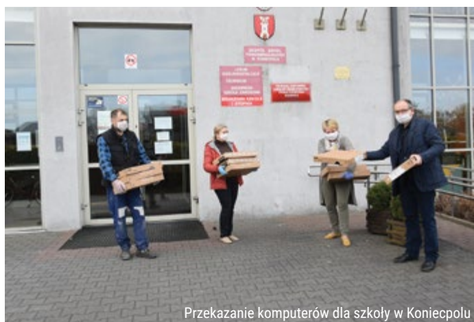
Przekazanie komputerów dla szkoły w Koniecpolu