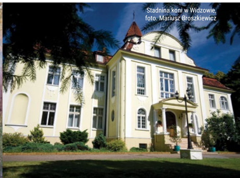
Stadnina koni w Widzowie