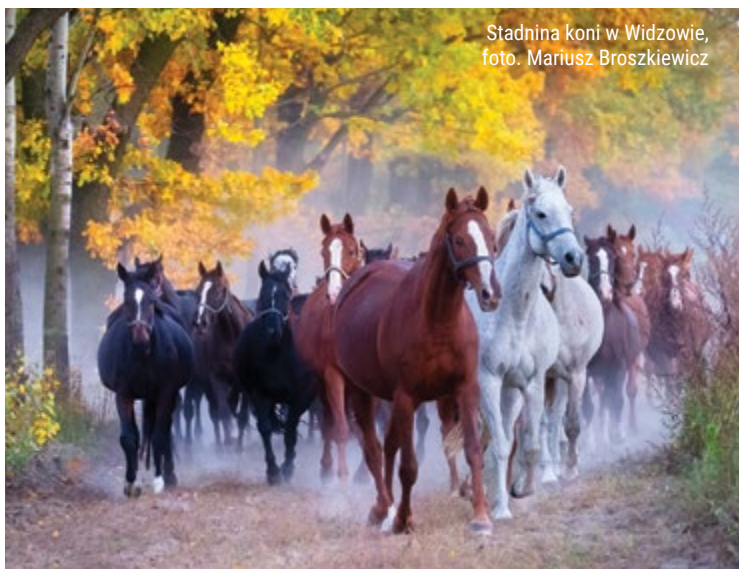
Stadnina koni w Widzowie, foto. Mariusz Broszkiewicz