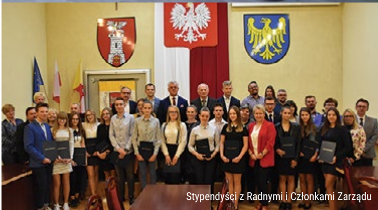
Stypendyści z Radnymi i Członkami Zarządu