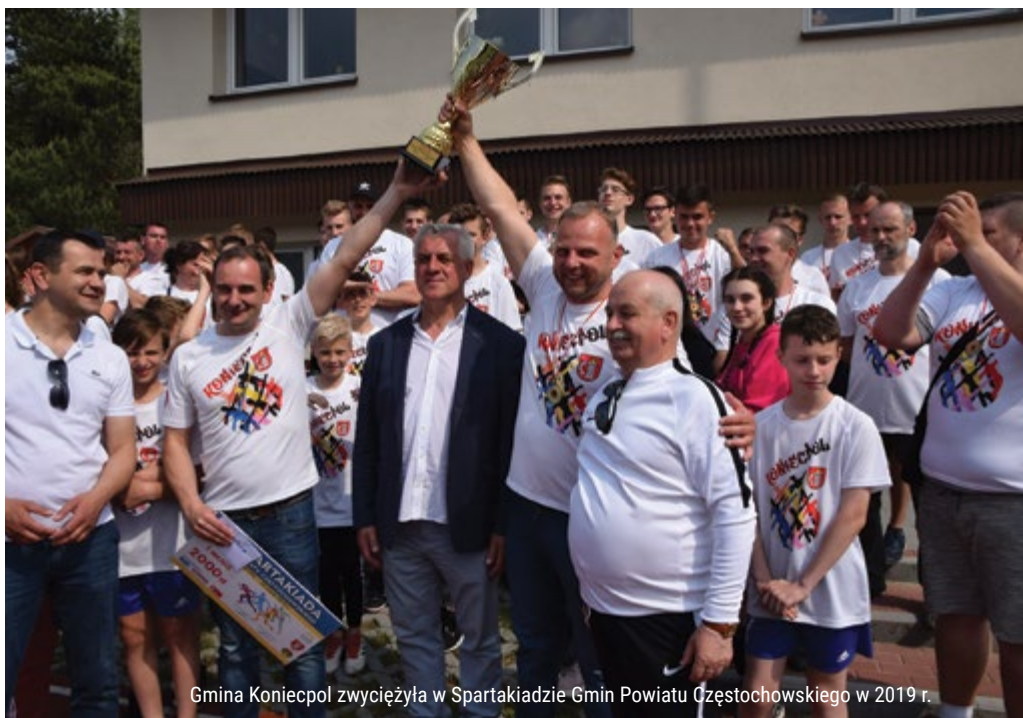
Gmina Koniecpol zwyciężyła w Spartakiadzie Gmin Powiatu Częstochowskiego w 2019 r.

Powiat Częstochowski aktywnie wspiera rozwój kultury fizycznej. Prowadzi i nadzoruje kluby sportowe wpisane do ewidencji starosty. Współdziała z organizacjami pozarządowymi i instytucjami sportowymi, które funkcjonują na terenie powiatu oraz miasta Częstochowy w zakresie organizowania wydarzeń sportowych i turystycznych. W 2019 roku Powiat Częstochowski współorganizował lub wsparł ponad 100 wydarzeń sportowych o różnym zasięgu, zarówno w ramach profesjonalnego współzawodnictwa jak i obywatelskich inicjatyw tworzących wydarzenia sportowe skierowane do amatorów w bardzo szerokim przedziale wiekowym. Zarząd Powiatu Częstochowskiego stara się także w miarę możliwości doceniać szczególne osiągnięcia oraz zaangażowanie w budowanie środowisk sportowych na terenie naszego powiatu, czego przykładem jest ubiegłoroczne podsumowanie działalności sportowej Powiatowego Zrzeszenia Ludowych Zespołów Sportowych (LZS). Na spotkaniu wręczono puchary, statuetki i upominki 43 zawodnikom, 11 trenerom i 11 działaczom reprezentującym organizacje sportowe, którzy uzyskali znaczące osiągnięcia indywidualne lub zespołowe na szczeblu powiatowym, wojewódzkim lub wyższym. W zawodach organizowanych przez LZS tylko w ubiegłym roku wzięło udział łącznie ponad 1 500 osób. Wydarzenia sportowe wspierane przez Powiat Częstochowski obejmują bardzo szeroką gamę dyscyplin, od sportu motorowego,