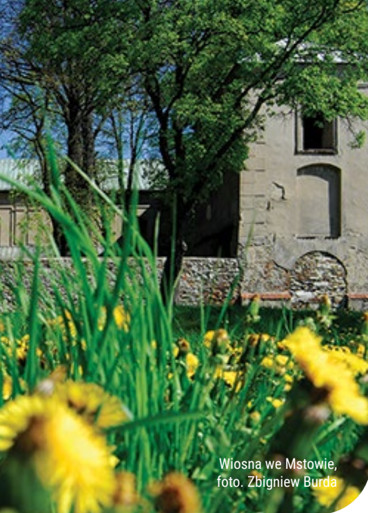
Wiosna we Mstowie, foto. Zbigniew Burda

2. NIEZANICIE (3 km). Nasza trasa rowerowa prowadzi przez przejazd kolejowy na ul. Zdrowskiej, ul. Niezanicą poprzez las polnym duktem w kierunku Niezanic. W dawnym pałacu W. Kornhoffer'a z 1919 r. znajduje się hotel i restauracja „Pałac Niezanicie”.