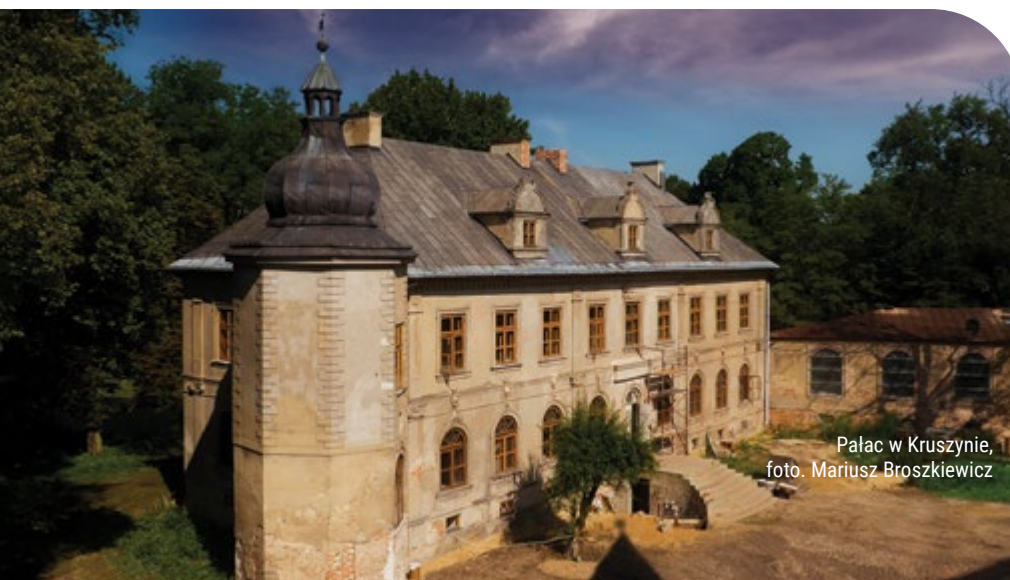
Pałac w Kruszynie

1. KŁOMNICE. Ze względu na dobry dojazd, szlak rozpoczynamy na dworcu PKP w miejscowości Kłomnice. Dworzec PKP jest związany z dawną Droga Żelazną Warszawsko-Wiedeńską. Naprzeciwko niego kolejowy budynek mieszkalny z końca XIX w. Z tej stacji wyruszyli Reszkowie ze swych majątków na światowe występy i tutaj przyjeżdżali ze swoimi bagażami. Ponadto, szwagier Reszków, Kronenberg, był szefem Banku Handlowego (udziałowca tejeż kolei). Dla nich, na stacji Kłomnice, zatrzymywały się nawet pociągi pospieszne. Opodal wiadukt szosy Radomsko – Częstochowa nad linią kolejową. W pobliżu dawny dworek Bugajów i zabudowania ich dawnej fabryki maszyn rolniczych. Trzeba również zwrócić uwagę na liczne tutaj kapliczki przydrożne, m.in.: św. Jana Nepomucena (róg ul. Częstochowskiej i Zdrowskiej), Matki Bożej NP na końcu ul. Bartkowieckiej, itp.