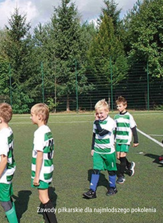
Zawody piłkarskie dla najmłodszego pokolenia