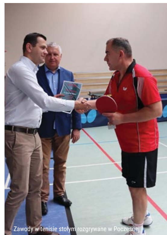
Zawody w tenisie stołm. rozgrywane w Poczesnej