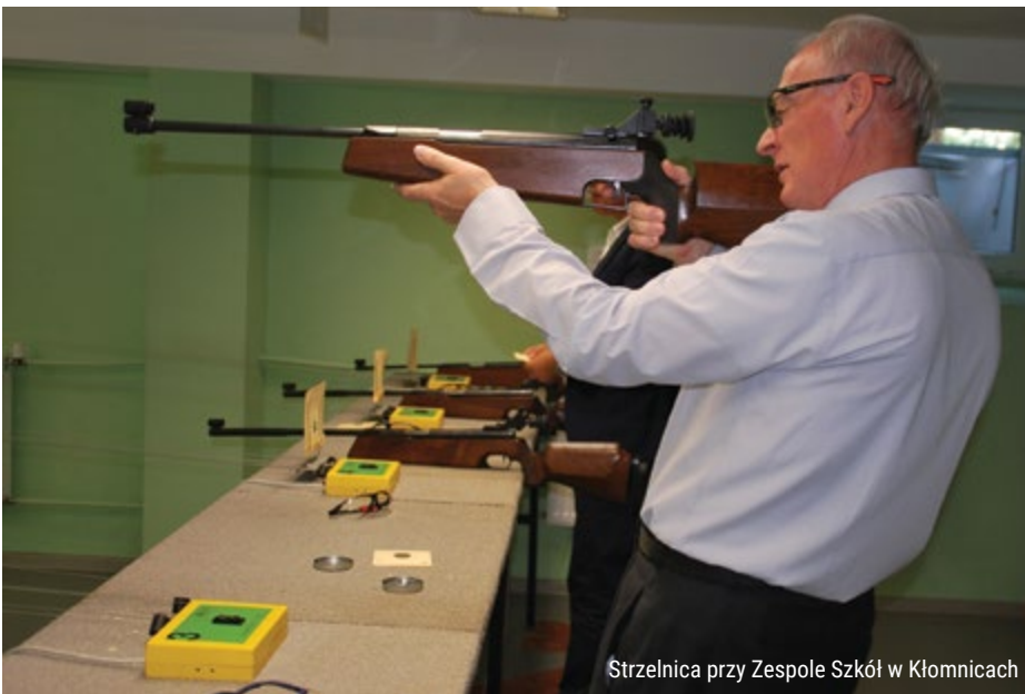
Strzelnica przy Zespole Szkół w Kłomnicach

niem integrującym wszystkie 16 gmin jest Spartakiada Powiatu Częstochowskiego , w której co roku udział bierze kilkaset osób obu płci w każdym wieku.