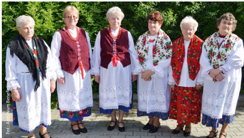
► Przedstawicielki Kół Gospodyń Wiejskich.

Gmina Porąbka – Porąbka, Czaniec, Kobiernice i Bujaków – malownicze tereny powiatu bielskiego, gdzie czynnie działają Koła Gospodyń Wiejskich i Gminny Ośrodek Kultury. Ich działalność poszerza ofertę kulturalną i turystyczną regionu, a także dba, by miejscowość zachowała stare obyczaje. Dzięki działaniu „Wdrażanie lokalnych strategii rozwoju” w ramach małych projektów udało się m.in. zorganizować warsztaty artystyczne i imprezę regionalną.