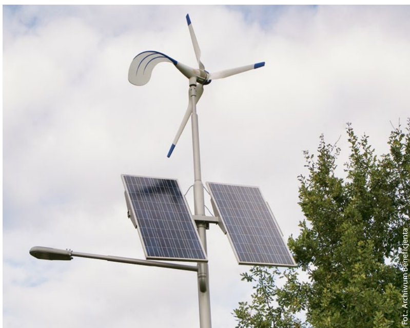
► Instalacja solarno-wiatrowa.

W naszym regionie coraz popularniejsze stają się działania proekologiczne, jak np. pozyskiwanie energii elektrycznej ze źródeł odnawialnych – korzystanie z energii słonecznej czy wiatrowej. Taki ekoprojekt zrealizowała gmina Mykanów w ramach działania „Podstawowe usługi dla gospodarki i ludności wiejskiej”.