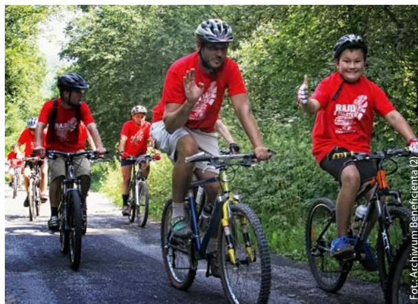
➤ Uczestnicy „Rajdu z Fałatem”.