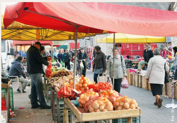
➤ Na targowisku w Żarkach nie brakuje amatorów świeżych owoców i warzyw.

W północnej części województwa śląskiego, w niewielkim miasteczku Żarki istnieje utwierdzone wielowiekową tradycją targowisko. W każdą środę i sobotę targ odwiedza 10 tysięcy osób. Na ponad 500 stoiskach można do woli wybierać lokalne produkty i przedmioty codziennego użytku. Aby usprawnić funkcjonowanie żareckiego targowiska, gmina podjęła się jego rozbudowy i modernizacji. Na ten cel pozyskała środki z Programu Rozwoju Obszarów Wiejskich na lata 2007-2013.