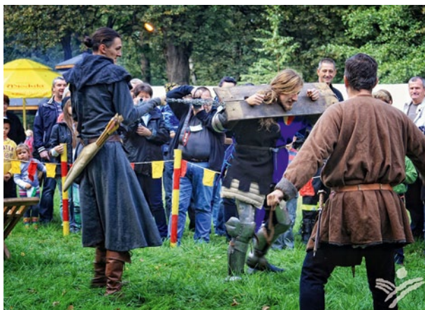
➤ Akcja „Powrót do przeszłości”.